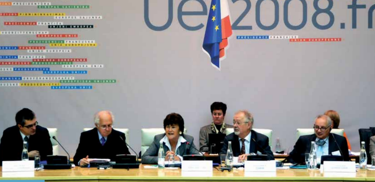
Četrto srečanje upravnega odbora v letu 2008 je na povabilo francoskega Inštituta za spremljanje javnega zdravja (InVS) potekalo novembra v Parizu v Franciji.