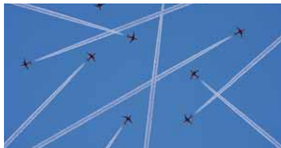
Sťahuje a presúva sa viac ľudí ako kedykoľvek predtým

Otázka migrácie a zdravia je v programe EÚ v posledných rokoch na poprednom mieste. Politický záväzok EÚ sa odráža v politických nástrojoch určených na zabezpečenie prístupu migrantov k zdravotnej starostlivosti a v programe Európskej komisie týkajúcom sa európskeho zdravia na roky 2003 – 2008 a v druhom programe činnosti Spoločenstva na roky 2008 – 2013 v oblasti zdravia. Druhý program obsahuje projekty týkajúce sa nerovnosti v oblasti zdravia, zdravotného stavu migrantov, záťaž infekčných ochorení a modelov poskytovania zdravotnej starostlivosti nezaregistrovaným migrantom. Agentúra ECDC tiež niekoľko rokov investovala prostriedky na zlepšenie pochopenia súvislosti medzi migráciou a verejným zdravím. Pre riešenie v oblasti zdravia a potrieb zdravotnej starostlivosti migrantov sa však dá urobiť viac. Agentúra ECDC sa zaviazala zlepšiť v nadchádzajúcich rokoch dohľad nad infekčnými ochoreniami a ich sledovanie s cieľom zabezpečiť, aby programy prevencie chorôb a boja proti chorobám reagovali na meniace sa vzorce migrácie a epidemiológiu infekčných ochorení a aby zdravotnícke služby reagovali na špecifické potreby populácií migrantov.