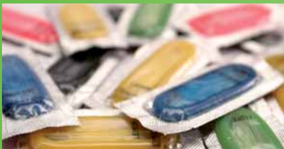
Prevenícia má zásadný význam