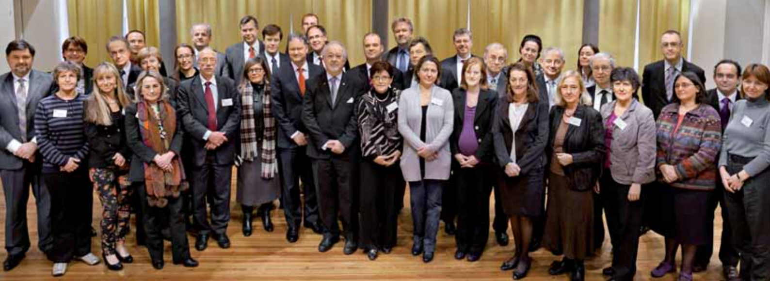
Riaditeľ's členmi správnej rady ECDC