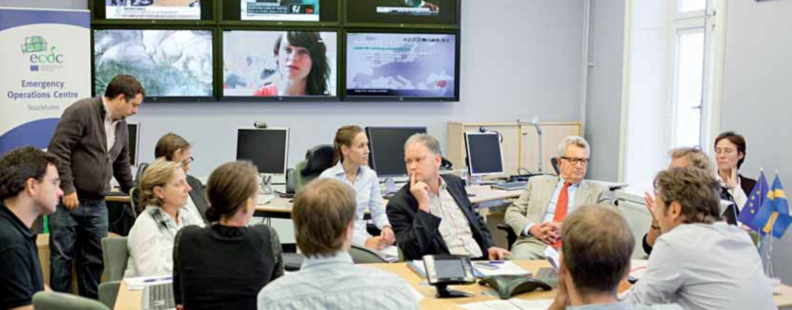
Zamestnanci agentúry ECDC sa denne schádzajú a monitorujú vypuknutie nákaz