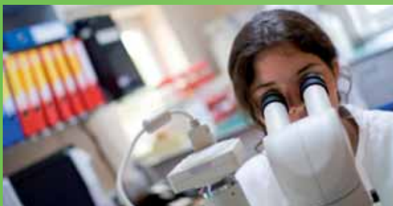
Agentúra ECDC má formálne dohody s národnými referenčnými laboratóriami