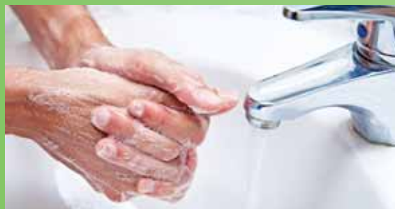
Jednoduché hygienické opatrenia môžu zamedziť šíreniu infekcií

chřípke, antivírusovými liekmi a vznikajúcou rezistenciou voči nim.