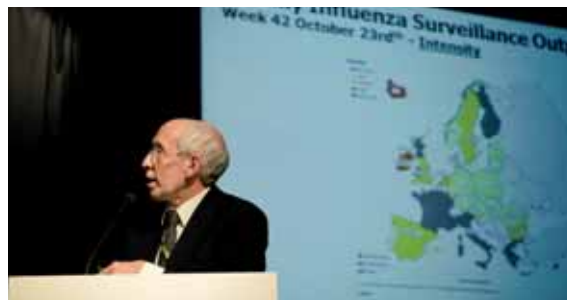
Výmena najnovších informácií o chrípke

Pri vytváraní odporúčaní týkajúcich sa novej sezónnej chrípky agentúra ECDC najprv posúdi riziko interne, pričom skúma skoré správy od národných úradov na určenie trendov, vzorcov prenosu, závažnosti, zraniteľných populácií a výsledkov. Zistenia, analýzy a navrhnuté odporúčania sú potom predložené členom poradného fóra ECDC a iným externým odborníkom, ktorí ich preskúmajú. S vývojom sezóny sa pozorne sleduje závažnosť a ak je zjavné, že sezóna bude náročnejšia ako zvyčajne, agentúra ECDC vydá varovanie úradom členských štátov, spoločenstvu v oblasti verejného zdravia a poskytne informácie verejnosti. Na základe virologických analýz potvrdených terénnymi štúdiami koordinovanými agentúrou ECDC sa posúdi vhodnosť očkovacej látky pre každú konkrétnu sezónu. Tak sa napríklad potvrdilo, že očkovacie látky pre sezónnu chrípku v roku 2010 ochránili pred vírusmi sezónnej chrípky. Sieť agentúry ECDC, VENICE (Európska sieť novej integrovanej spolupráce v oblasti očkovacích látok), sleduje tiež použitie očkovacích látok na národnej úrovni. Na žiadosť Európskej agentúry pre lieky (EMA) dva nadnárodné nezávislé vedecké prieskumy koordinované agentúrou ECDC skúmali špecifické výhrady týkajúce sa bezpečnosti očkovacích látok.