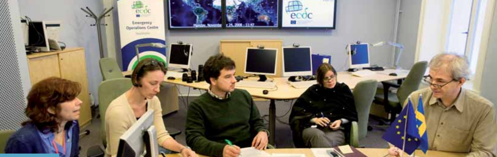
Centrul de gestionare a urgențelor al ECDC. Inaugurat în martie 2008, acesta activează în regim de gardă non-stop, implicând 38 de angajați și asigurând evaluarea permanentă a amenințărilor emergente pentru sănătate în cadrul UE