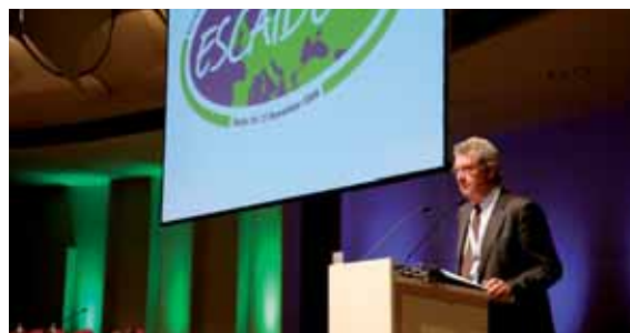
Johan Giesecke, cientista-chefe do ECDC, na conferência Escaide, em Novembro de 2008.

Em 2008, no âmbito dos esforços que desenvolveu para se tornar um catalisador da investigação em matéria de saúde pública e uma fonte primordial de aconselhamento científico sobre doenças transmissíveis na Europa, o ECDC: