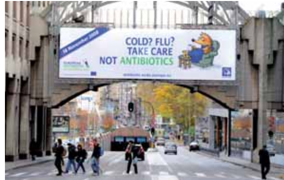
Cartaz da campanha do Dia Europeu de Sensibilização para os Antibióticos, afixado na zona dos edifícios da União Europeia em Bruxelas (Bélgica), em Novembro de 2008.

O ECDC consolidou significativamente a sua infra-estrutura e, actualmente, divulga com sucesso informação científica e técnica dirigida a audiências especializadas. O público em geral é igualmente informado sobre as actividades do Centro. Principais progressos em 2008: