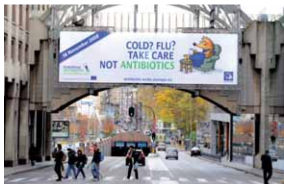
Affiche de la Journée européenne de sensibilisation aux antibiotiques, en novembre 2008 à Bruxelles (Belgique).

L'ECDC a fortement consolidé son infrastructure et diffuse aujourd'hui avec succès des informations scientifiques et techniques auprès d'audiences spécialisées. Le grand public est également informé des activités du Centre. Les