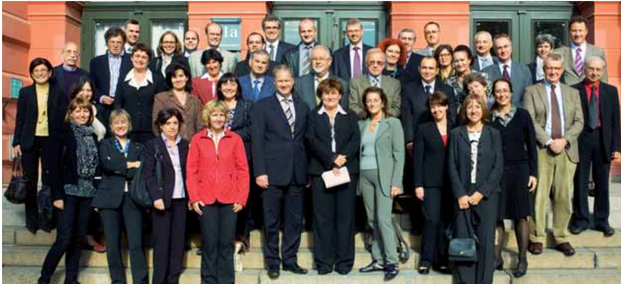
ECDC:n hallintoneuvosto syyskuussa 2008 pidetyssä ylimääräisessä kokouksessa, jossa keskusteltiin keskuksen ensimmäisen ulkoisen arvioinnin tuloksista