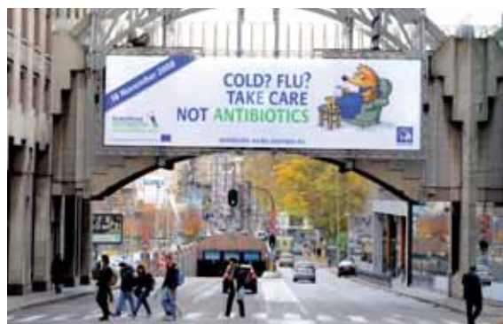
Cartel de la campaña del Día Europeo para el Uso Prudente de los Antibióticos en la zona de la UE de Bruselas (Bélgica), en noviembre de 2008.

El ECDC ha consolidado su infraestructura considerablemente y en la actualidad difunde con éxito información técnica y científica a públicos especializados. También mantiene informado al público general sobre las actividades del Centro. Principales logros en 2008: