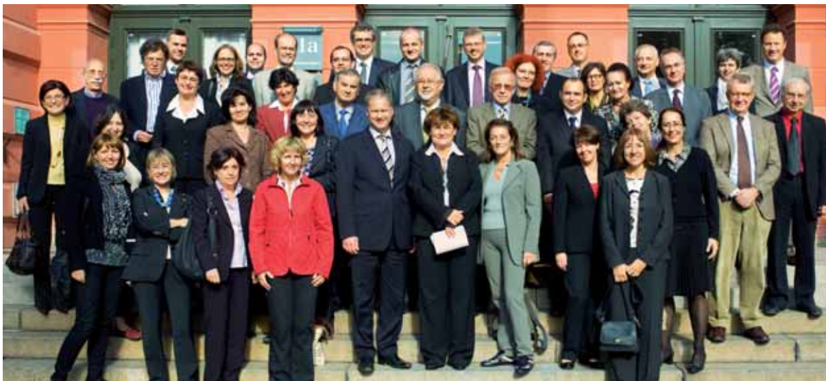
ECDC's bestyrelse i september 2008, hvor den afholdt et ekstraordinært møde for at drøfte resultaterne af den første eksterne evaluering af centret.