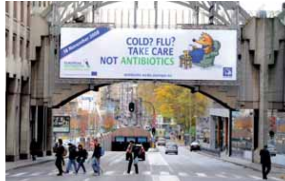
Plakat for kampagnen i forbindelse med den europæiske antibiotikadag i EU-kvarteret i Bruxelles, Belgien, november 2008

ECDC har konsolideret sin infrastruktur betydeligt og formidler i dag med succes videnskabelig og teknisk information til specialiserede målgrupper. Den brede offentlighed holdes også orienteret om centrets aktiviteter. Væsentlige resultater i 2008: