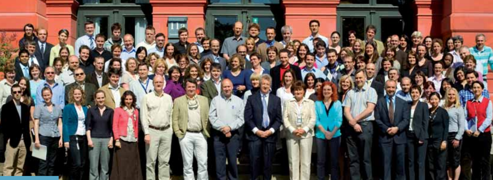
Medarbejdere i maj 2008