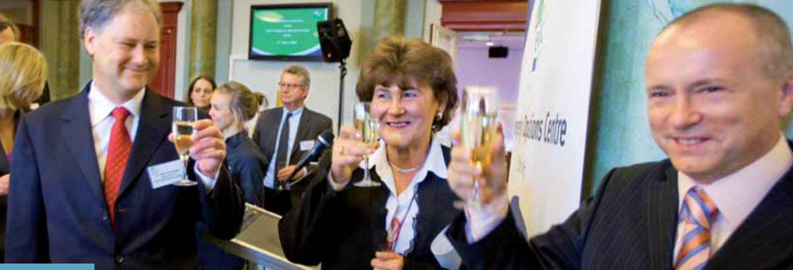
Марк Спренгер, бивш председател на управителния съвет, Жужана Якоб, директор на ECDC, и д-р Мирослав Узки, член на Европейския парламент, на откриването на центъра за действия в извънредни ситуации към ECDC през март 2008 г.