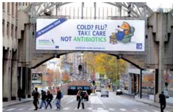
Плакат за кампанията Европейски ден на антибиотиците в района на институциите на ЕС в Брюксел през ноември 2008 г.

ECDC консолидира в значителна степен своята инфраструктура и понастоящем разпространява успешно научна и техническа информация сред специализирани групи потребители. Наред с това Центърът информира и обществеността за осъществяваните от