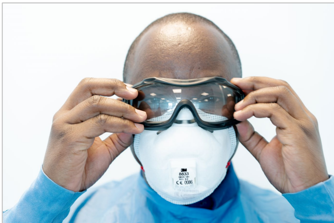
Figura 10. Kif tilbes il-gogils biċ-ċinga elastika tad-drapp

Ladarba r-respiratur ikun ippożizzjonat eżatt, ilbes il-gogils għall-protezzjoni għall-ghajnejn. Poġġi l-gogils fuq iċ-ċineg tal-maskla u kun żgur li ċ-ċinga elastika tad-drapp toqgħod eżatt - iżda mhux issikkata żżejjed (Figuri 10 u 11).