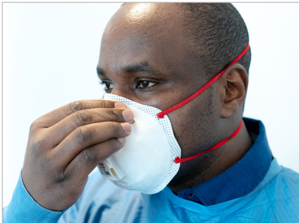
Figura 7. Kif tqiegħed f'potha l-klipp tal-imnieher tal-metall tar-respiratur

Jekk tilbes maskla tal-wiċċ (maskla tal-kirurgija) minflok respiratur (Figura 8), huwa importanti li tippożizzjonaha b'mod korrett fuq il-wiċċ u taġġustaha bil-klipp tal-imnieher tal-metall (Figura 9) sabiex tkun tiġik sew.