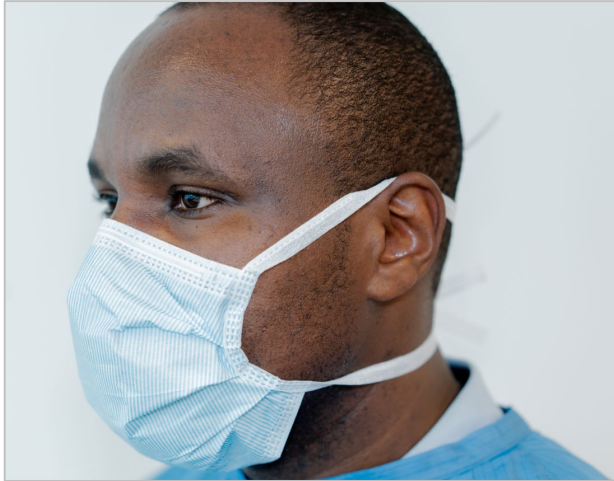
Figura 9. Kif tqiegħed f'potha l-klipp tal-imnieħer tal-metall