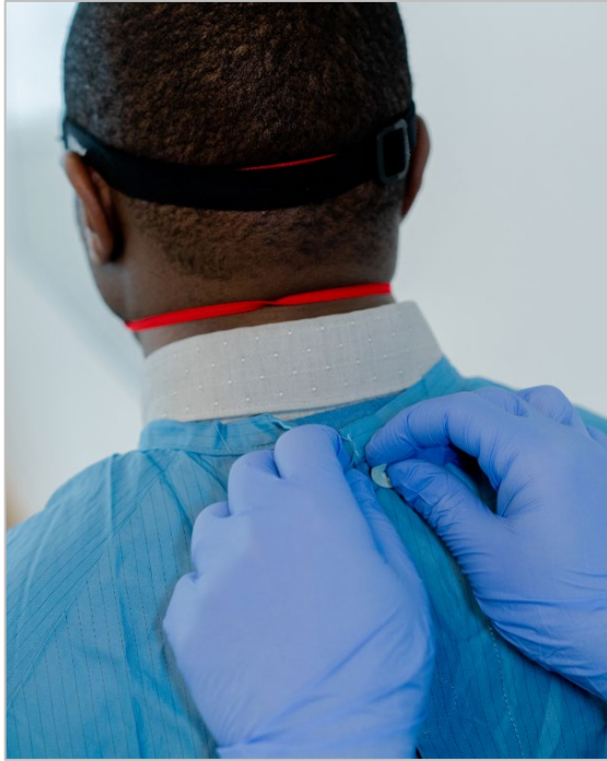
Figura 16. Kif tneħhi l-ġagaga: billi taqbad il-ġagaga minn wara