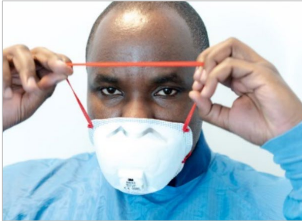
Figura 6. Kif tilbes respiratur FFP (klassi 2 jew 3)

Il-klipp tal-imnieher tal-metall trid tiġi aġġustata (Figura 7) u ċ-ċineg għandhom jinqafu u jkunu ssikkati biex joqogħdu f'pothom sew u jkunu komdi. Jekk ir-respiratur ma jkunx jista' jiġi sew, ippożizzjona ċ-ċineg f'forma ta' salib. Madankollu, din il-modifika żgħira tista' timplika devjazzjoni mir-rakkomandazzjonijiet fil-manwal tal-prodott tal-manifattur.