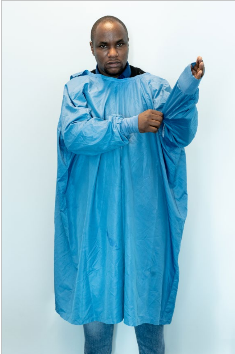
Figura 5. Kif taqfel il-buttuni fuq wara tal-ġagaga; dan isir minn assistent