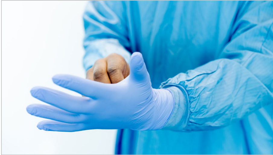
Figura 13. Kif tilbes l-ingwanti