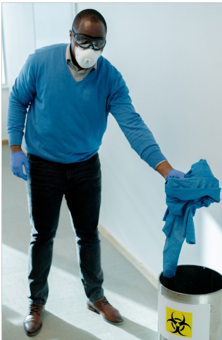
Figura 18. Kif tpoġġi l-ġagaga f'kontenitur għar-rimi ta' oġġetti ta' periklu bijoloġiku biex tiġi diżinfettata

Il-ġagagi li jintlibsu darba biss issa jistgħu jintremew; il-ġagagi li jistgħu jerġgħu jintużaw għandhom jitpoġġew f'basket jew kontenitur biex jiġu diżinfettati (Figura 18).