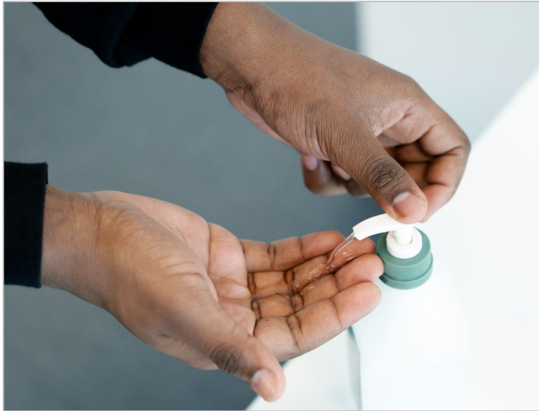
Figura 3. L-iġjene tal-idejn li ssir bl-użu ta' soluzzjoni bbażata fuq l-alkoħol

Qabel ma tilbes il-PPE għall-ġestjoni ta' każ suspettat jew konfermat tal-COVID-19, għandek tagħmel l-iġjene adatta tal-idejn skont ir-rakkomandazzjonijiet internazzjonali [7]. Dan hu aspekt kritiku f'dan l-ambjent u għandu jsir b'użu ta' soluzzjoni bbażata fuq l-alkoħol f'konformità mal-istruzzjonijiet tal-manifattur (Figura 3).