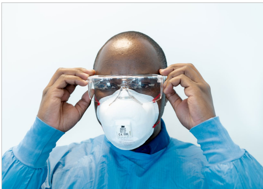
Figura 12. Kif tilbes gogils wesgħin

Wara l-gogils, imiss l-ingwanti. Meta tilbes l-ingwanti, huwa importanti li testendi l-ingwanta biex tkopri l-polz fuq il-pulzieri tal-ġagaga (Figura 13). Għal dawk li jkunu allergiċi għal ingwanti tal-latex, għandu jkun hemm disponibbli opzjoni alternattiva, pereżempju ingwanti tan-nitril.